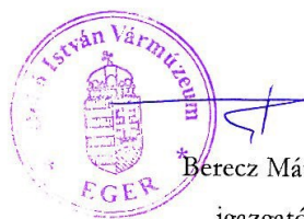
Berecz Mátyás igazgató