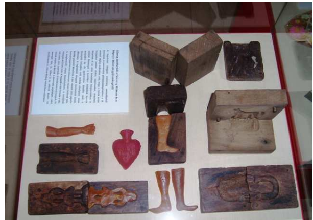
Fogadalmi tárgyak öntőmintái