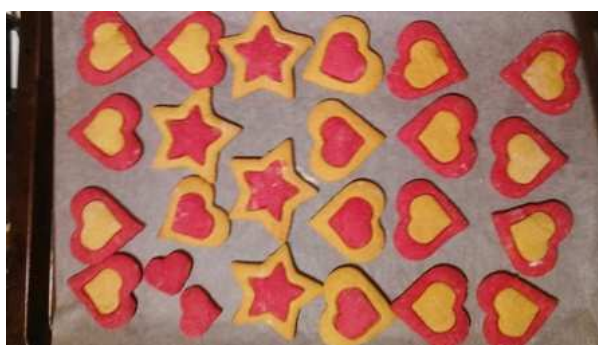
Kisült a kalácsunk