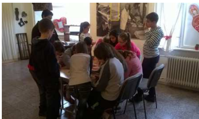
Mézesbáb díszítés Ráckeviden