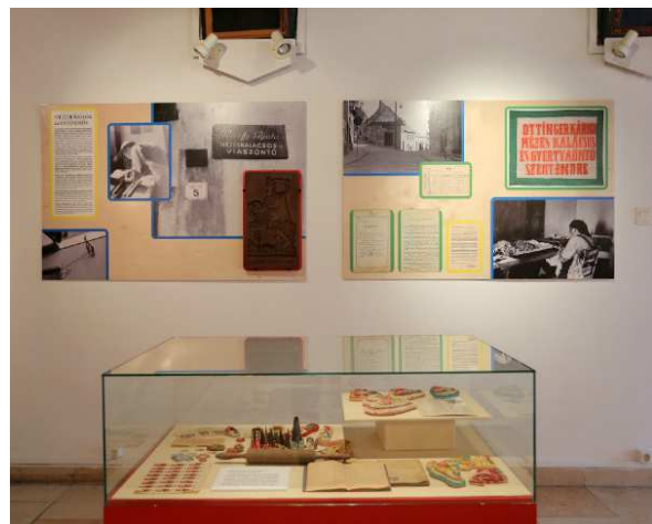
A kiállítás szentendrei vonatkozású részlete

A kiállítás és a rendezvények ismeretterjesztő szándéka megvalósult. A mai városi generációk számára a mézeskalács a cukorhabbal mintázott karácsonyi süteménnyel azonos. A látogatók sokat kérdeztek a kétféle készítési eljárásról, rácsodálkoztak az ütőfák művészi formavilágára, szimbolikájára, a háziasszonyok műtárgy-másolatot szerettek volna beszerezni otthonra. Kurátorként, néprajzusként értékes adatokat gyűjtöttem néhány látogatótól, akik történeteket meséltek a karácsonyi mézeskalácsról, a sütemény más ajándékozási alkalmairól, gyerekkori élményekről, búcsúvásárokról. Emlékeik alapján gyarapodtak ismereteink a szentendrei műhelyekről, mesterekről.