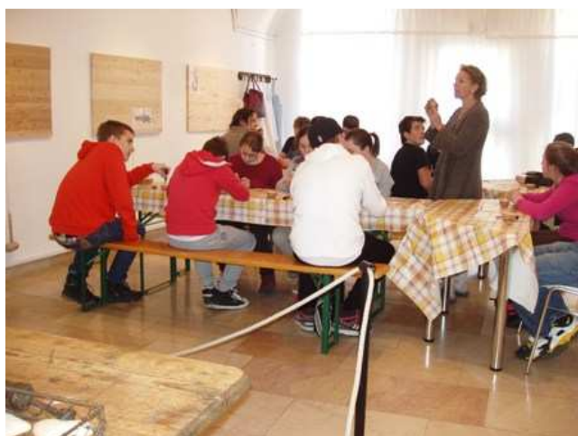
Kézműves foglalkozás Szentendrén