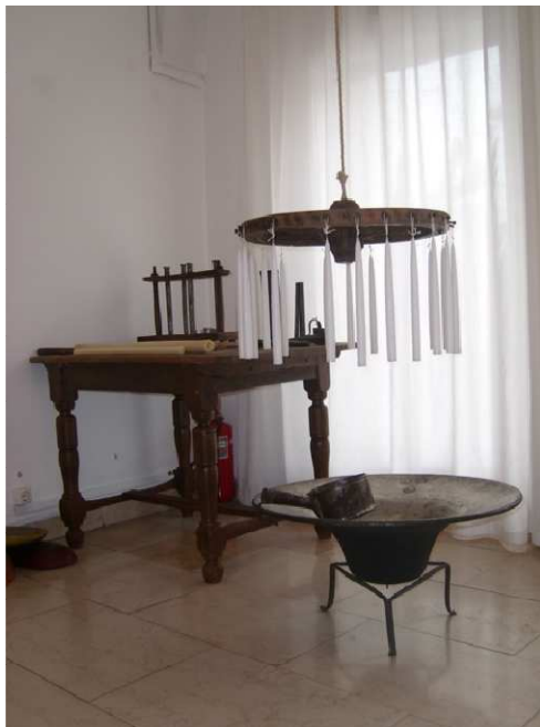
A gyertyamártó műhely részlete