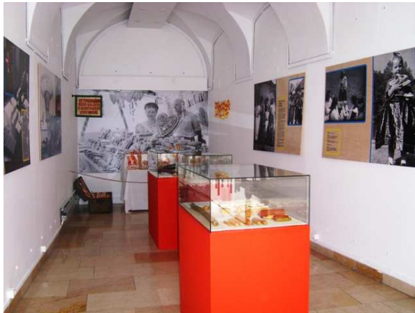
A második terem