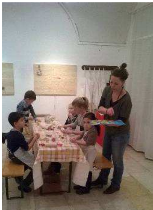
Adventi foglalkozás Szentendrén