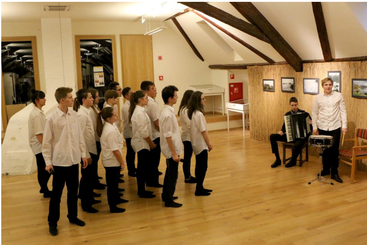
A emlékezetes műsort az Érdi Gárdonyi Géza Általános Iskola és Gimnázium diákjai adták