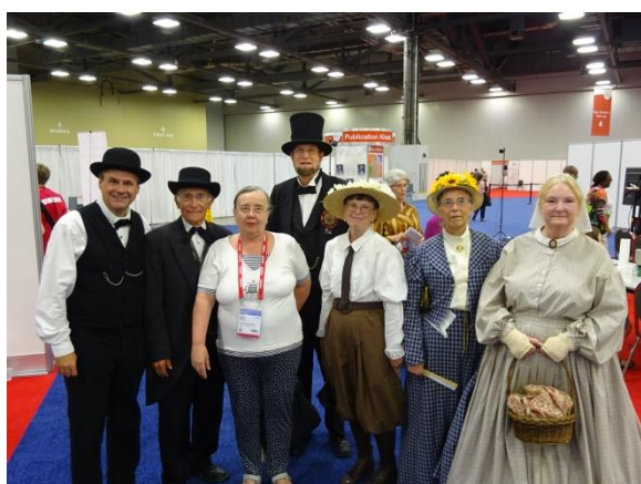
Történelmi arcképcsarnok a kiállításon