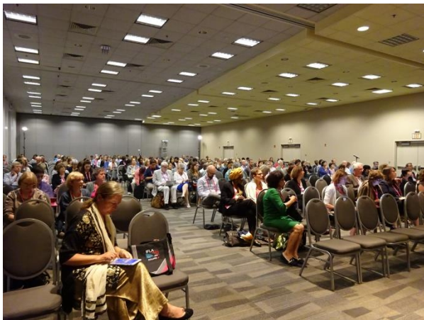
A Tudásmenedzsment Szekció programja

A konferencia kiemelkedő eseményei voltak a reggelenként megszervezett plenáris ülések, ahol az USA könyvtárainak, kultúrájának legfontosabb mozzanataiba pillanthattunk be.